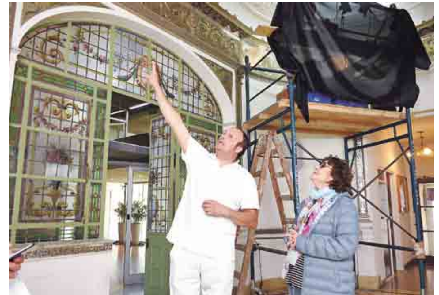
"Hay figuras que están prácticamente perdidas que no se pueden recuperar y debemos definir cuál va a ser el método de intervención. Lo más importante que se debe hacer es la consolidación de la película pictórica que se está desprendiendo".