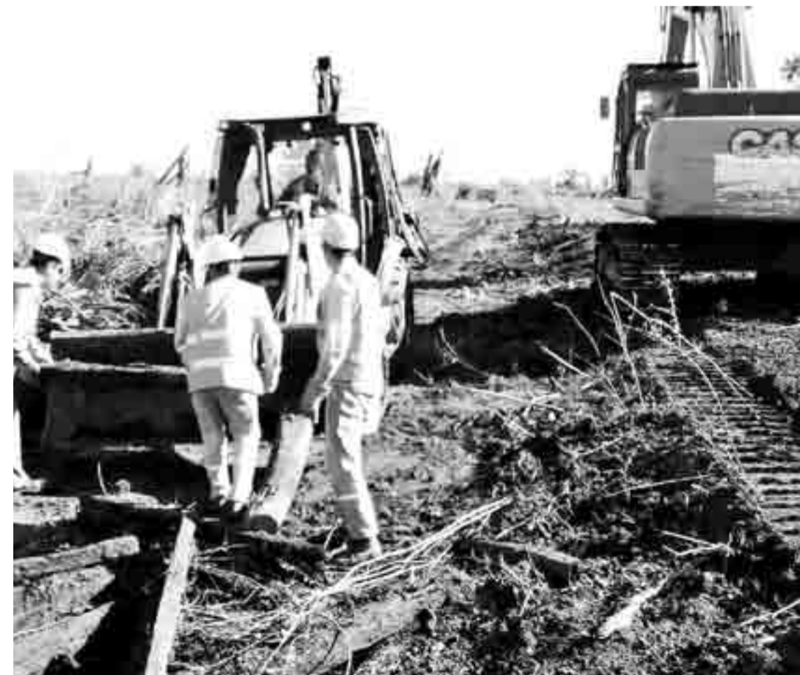
Con los trabajos, se potenciará la red ferroviaria del Belgrano Cargas, que une el norte argentino.

desarrollo. El transporte ferroviario de cargas moderno y acorde a las necesidades de cada vecino y vecina es uno de los objetivos centrales del plan de modernización del transporte”.