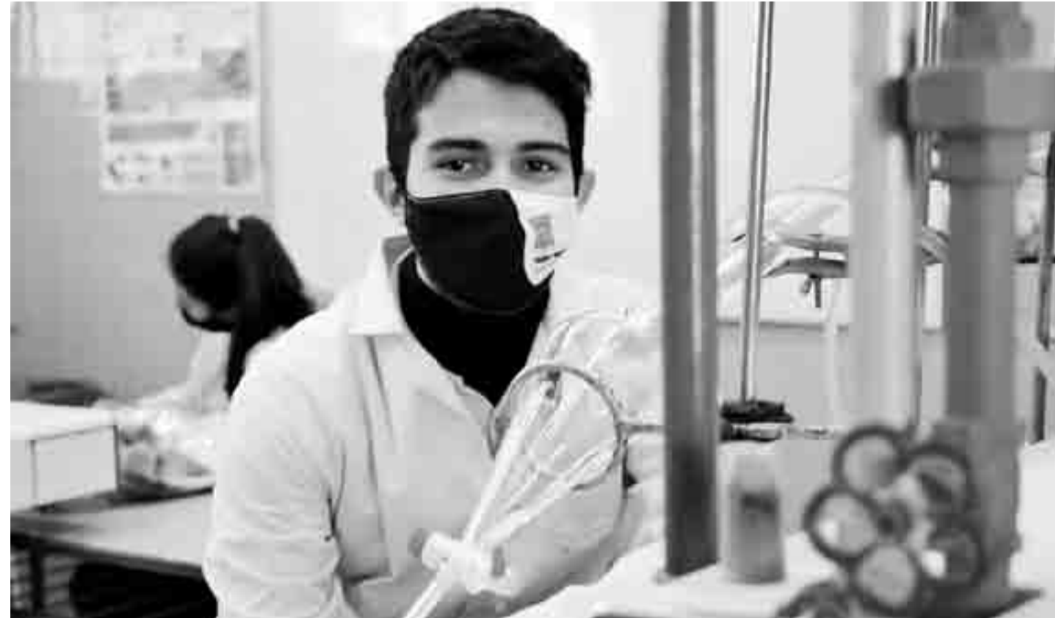
El joven de la ciudad de Santa Fe se clasificó a las Olimpiadas Internacionales de Química que van a realizarse en julio, de manera virtual y organizadas por China.

A pesar de ser entrenamientos en equipo, y estar todos juntos en Buenos Aires mientras se desarrolla la competencia, la participación es individual e incluye "una parte teórica múltiple choice acompañada