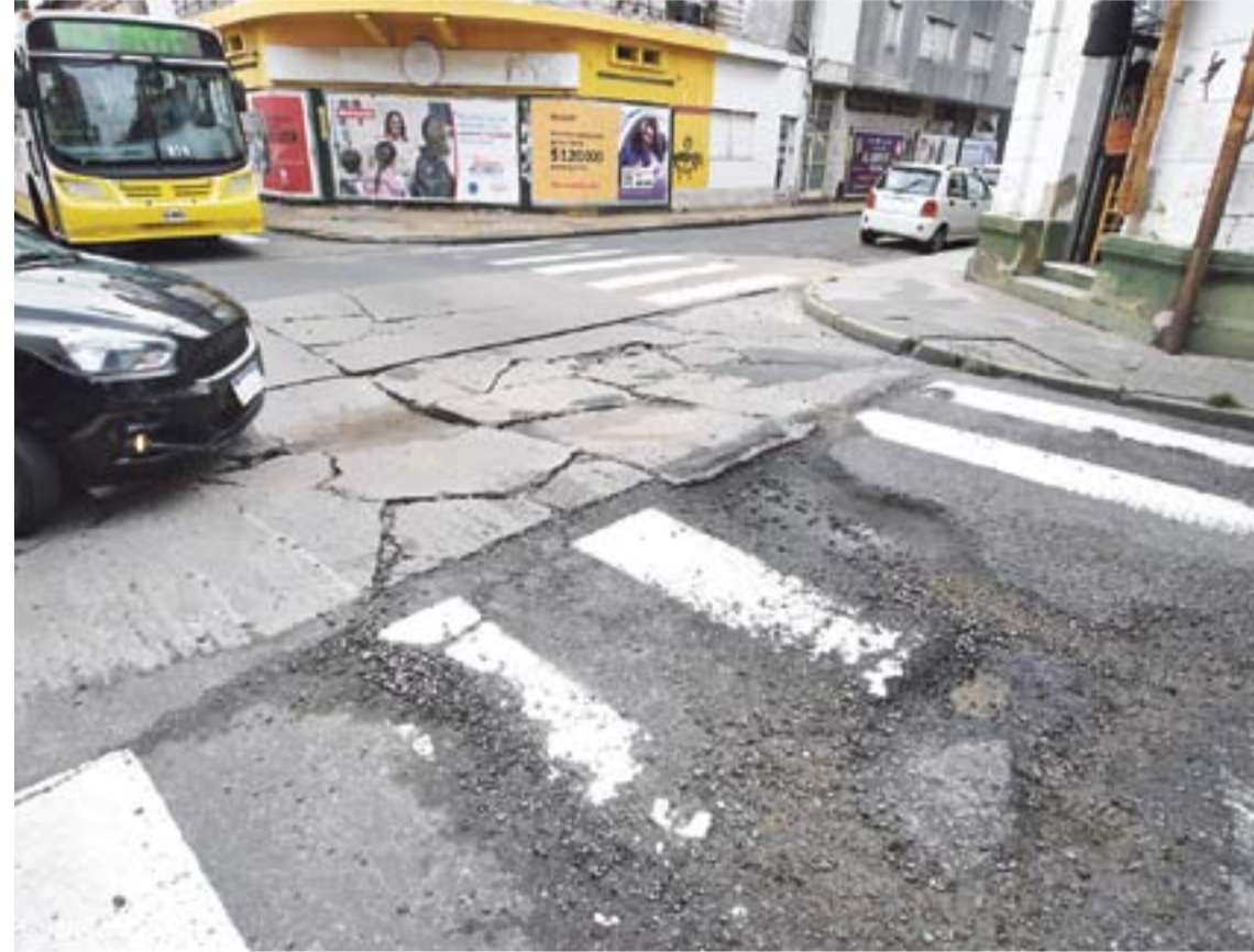
Un sector de la ciudad -San Jerónimo e Hipólito Irigoyen- “detonado” por los baches.

Hoy, huelga recordar, rige una ordenanza en la ciudad (sancionada en 2019) que ordena y regula la actividad informal de los cuidadores de vehículos pero, en los hechos, no se aplica. Lo último que se supo es que el municipio local “analizaba” modificar la normativa vigente.