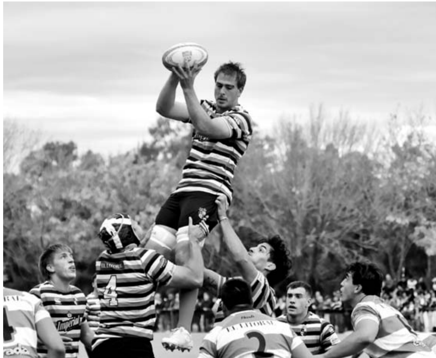
Se fue un nuevo clásico entre Santa Fe y CRAI, donde al ganador no le sobraba nada. Y dónde el perdedor se pudo haber llevado algo más si las tomas de decisiones hubieran sido otras.