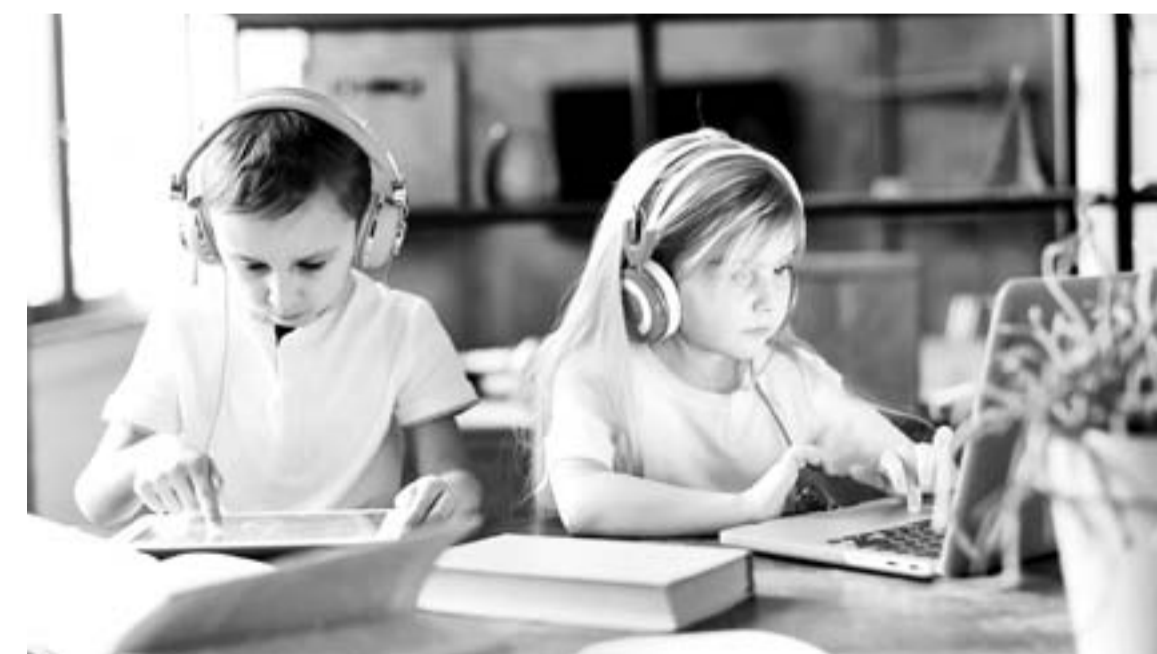
La realidad aumentada como herramientas de alfabetización.