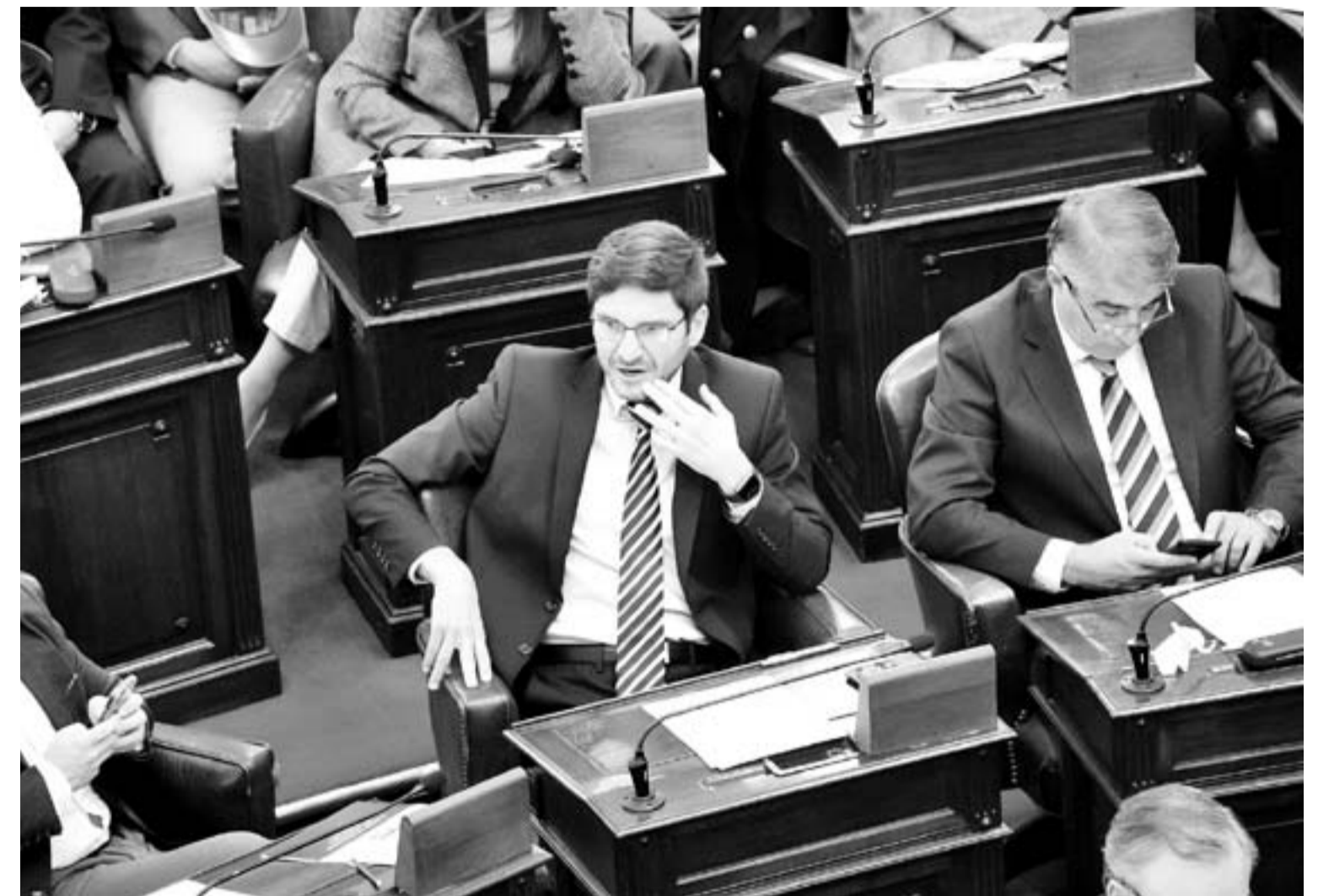
Legisladores de la oposición mostraron su descontento con el discurso de Perotti.

“Es un gobernador que se tomó tres años para pelear con la oposición y hoy nos viene a relatar las obras que había iniciado el Frente Progresista. Vamos a mirar con detalle los números que citó en el discurso porque las cifras oficiales publicadas muestran que en lo que