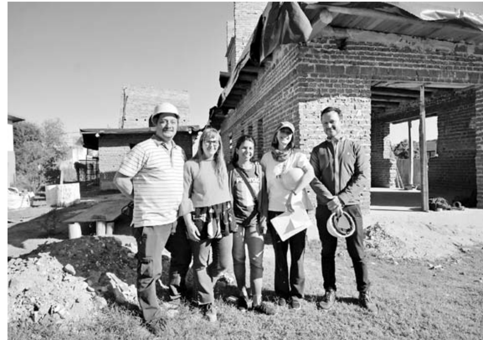
Las dos casas “mellizas” hechas con ladrillos de adobe.

“Tendremos una huerta común y compostaje. Las casas van a tener