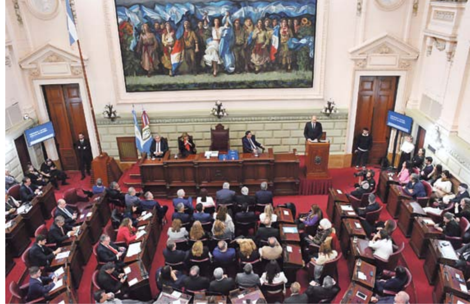
El gobernador optó por dirigir fuertes reproches al gobierno nacional al hablar de la inseguridad. Seguridad fue tópico más breve pero también el más contundente.

"No nos gusta y nos duele el escenario actual", admitió. Recordó