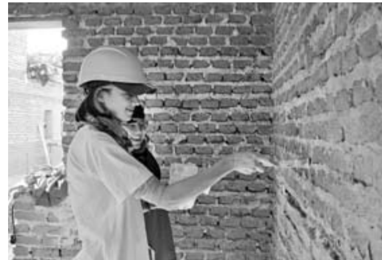
Trabajadoras de Teko en obra; la cooperativa tiene hoy 45 integrantes.

El arquitecto consideró que el anterior reglamento de edificación