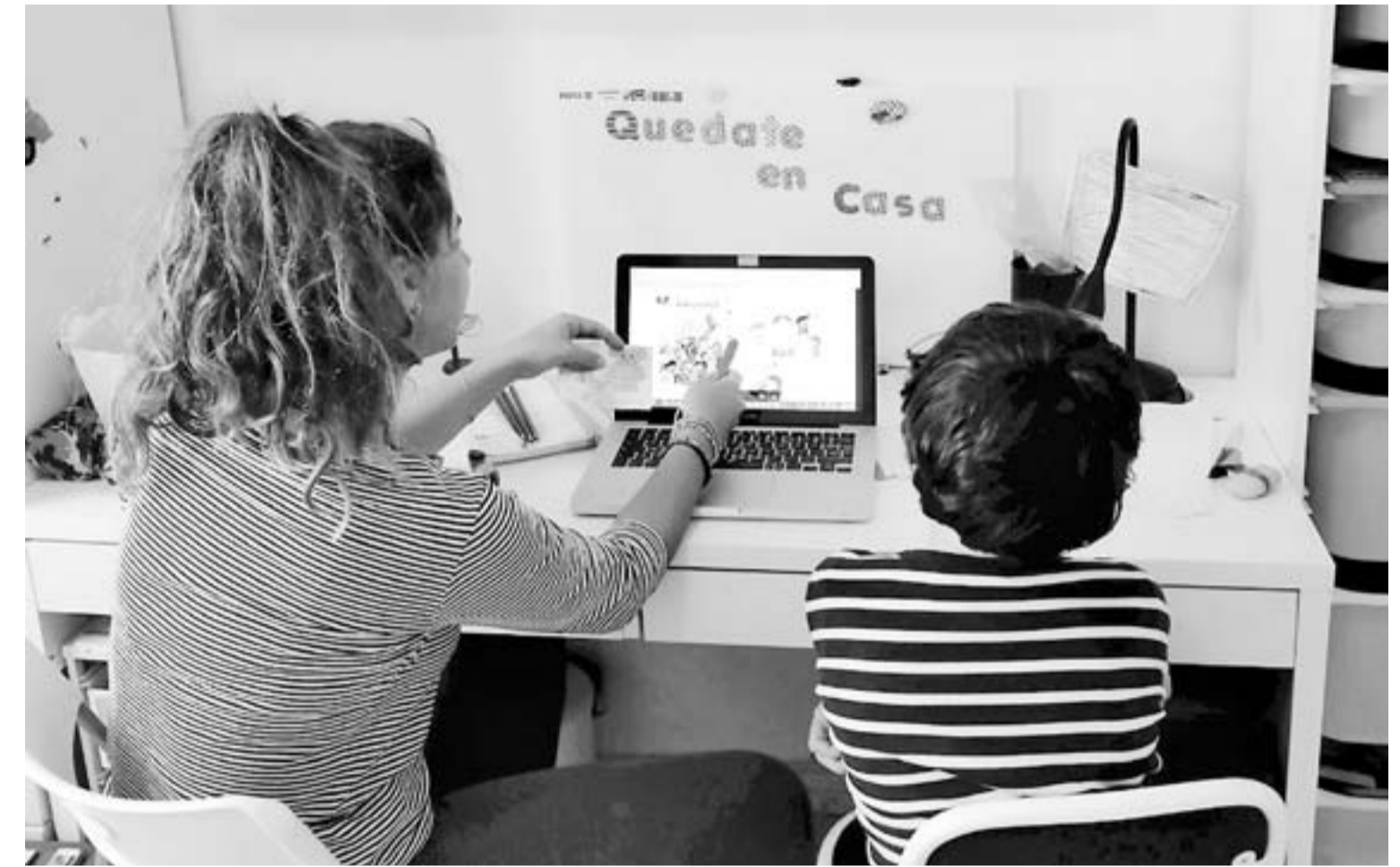
La experiencia se realizó con niñas y niños de dos escuelas de la ciudad.