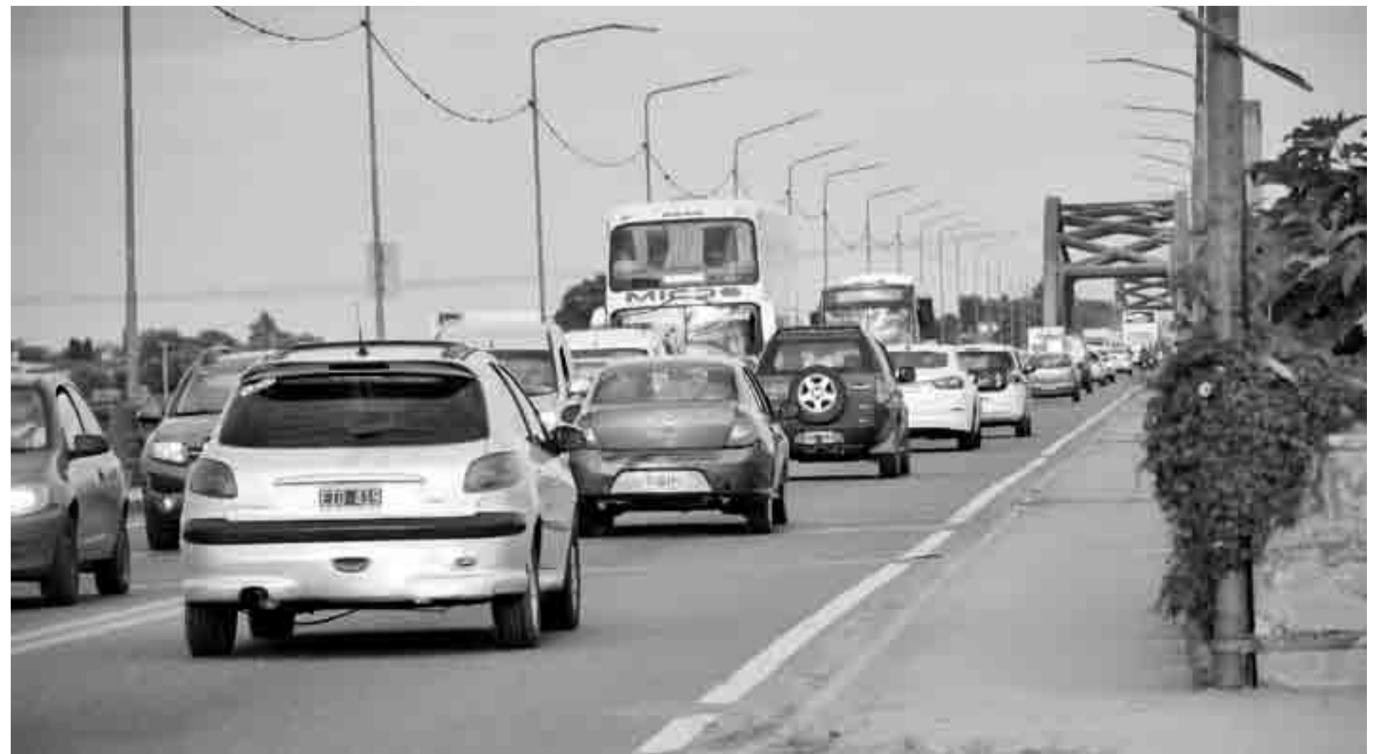
Cargado. Actualmente por el Carretero pasan unos 45 mil vehículos por día y un futuro tren permitiría descongestionar esta vía.