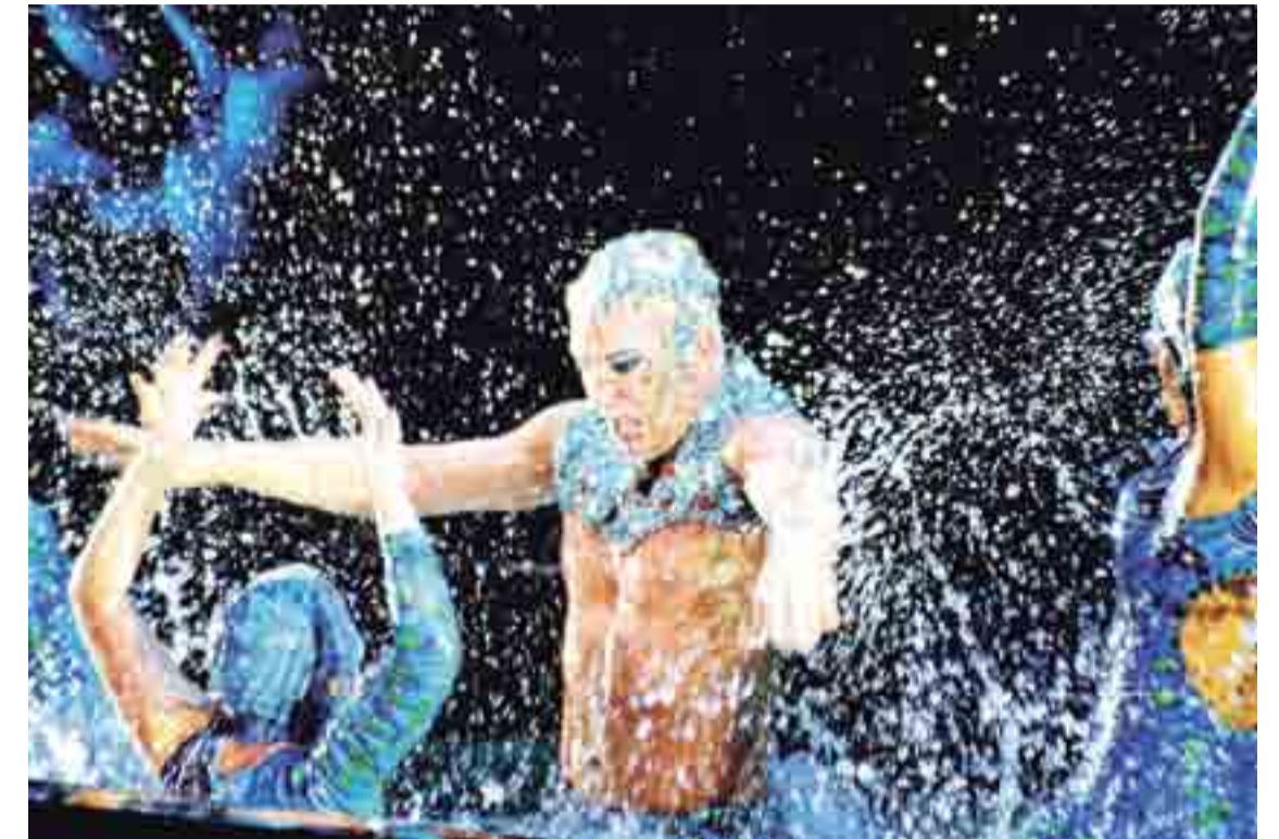
En una charla con Notife anticipó lo que se podrá ver en el show del 29 y 30 de abril, a las 19 y 21.30, en la Estación Belgrano.

Perdí muchas personas que amaba y ahora tengo a mi hijo; son muchas cosas que pasaron en estos diez años; vengo ahora de la pérdida de un amigo, que tuvo que ver porque hacía vestuario en el espectáculo. Tiene una cosa muy visceral mía, me conecta con cosas hermosas y tristes. En este espectáculo se cuenta mucho de eso: el pasado, el presente y el futuro, no solamente del espectáculo sino también mío. Pero el final del cuento es la felicidad plena.