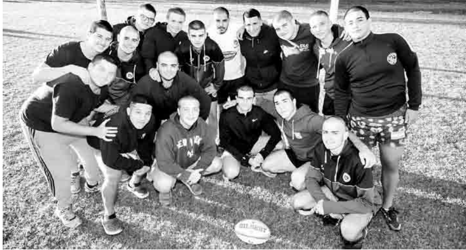
“Me puse feliz, lloré de la emoción cuando lo vi a Mati. Y ahí empezamos todos, uno por uno. Yo tenía el pelo re largo antes”, recordó Quimey.

Hace meses que el joven atraviesa un momento familiar delicado por una grave enfermedad que padece su mamá. Hoy va a las prácticas del equipo juvenil Los Caranchos con una sonrisa al ver la empatía de sus compañeros, y su familia lo agradece.