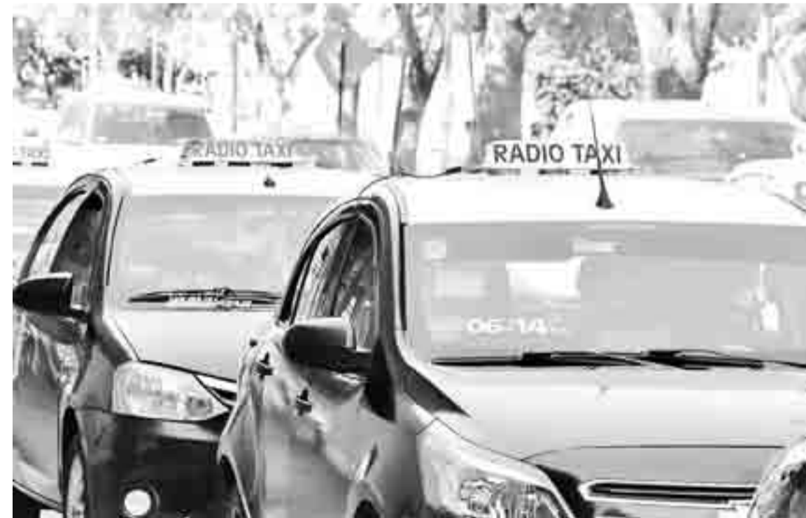
"Es un sistema que claramente hay que mejorar en la ciudad, entendemos que es muy importante porque brinda un servicio necesario para vecinos y vecinas y es importante por las fuentes de trabajo que genera", manifestó González.