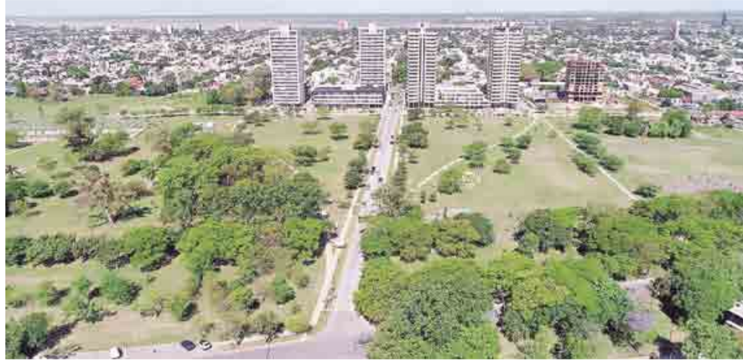
La intervención integral de las 7 hectáreas del mayor pulmón verde de la ciudad iniciará en mayo y estiman que finalizará entre septiembre y octubre.

Se incorporarán en total 400 focos led que se ubicarán en torres y columnas, plantarán 200 ejemplares arbóreos y el camino para peatones se construirá paralelo a la bicisenda que atraviesa todo el parque. Las propuestas fueron presentadas a los vecinos en la Mesa de Consenso y Gestión de este espacio público.