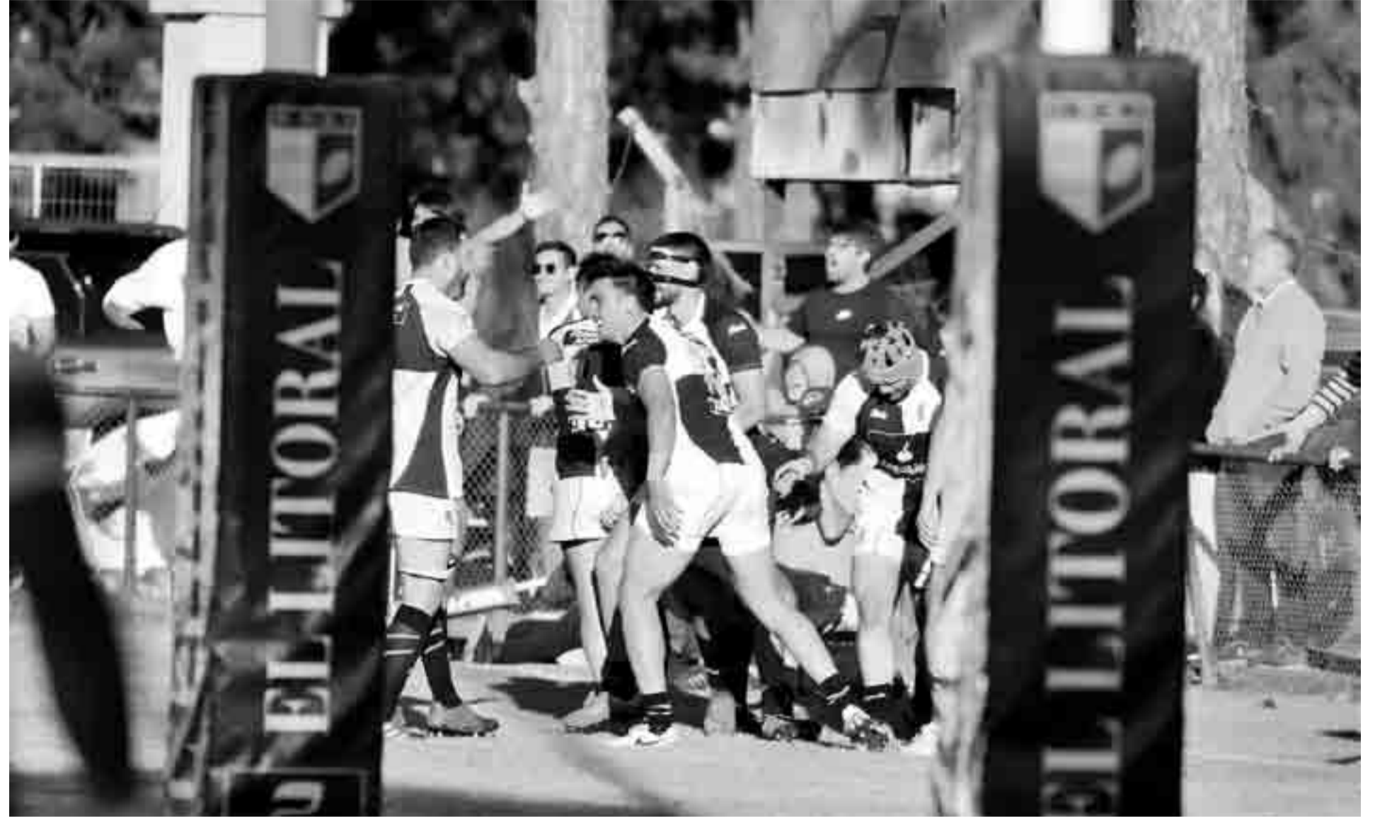
Try consumado. De esa forma, CAE empezaba a dar vuelta el resultado ante CRAI.

El conjunto de Paraná venció a CRAI 22 a 16 y de esa manera continúa siendo puntero invicto en el TRL. SFRC derrotó a Rowing. En Segunda, importante victoria de La Salle ante Alma Juniors. Cha Roga ganó en Santo Tomé.