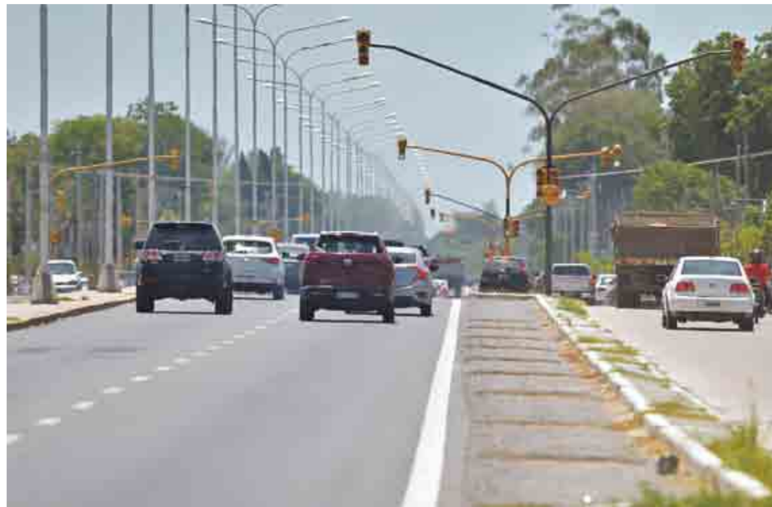
La falta de señalización que sirva para ordenar el caótico tránsito en las colectoras -dentro del urbanizado tramo de Colastiné- fue tema de debate en el Legislativo local.

Un edil opositor criticó al municipio por no colocar cartelería que ordene el tránsito en el tramo de Colastiné. Advirtió que los accidentes se repiten a diario, y pidió más controles. Desde el oficialismo se lo cuestionó por "poco responsable en sus palabras". En el medio, la "herencia" de la obra de Av. Freyre.