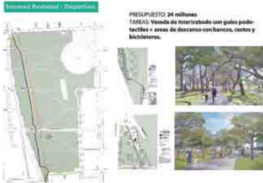
PRESUPUESTO: 24 millones TAREAS: Vereda de intertrabado con guías podotáctiles + áreas de descanso con bancos, cestos y bicicleteros.

Las estrategias integrales de intervención incluyen la mejora de los senderos que atraviesan el parque. Se realizará una vereda nueva que irá desde Salvador del Carril hasta Luciano Torrent de intertrabado con guías podotáctiles (material para facilitar el desplazamiento