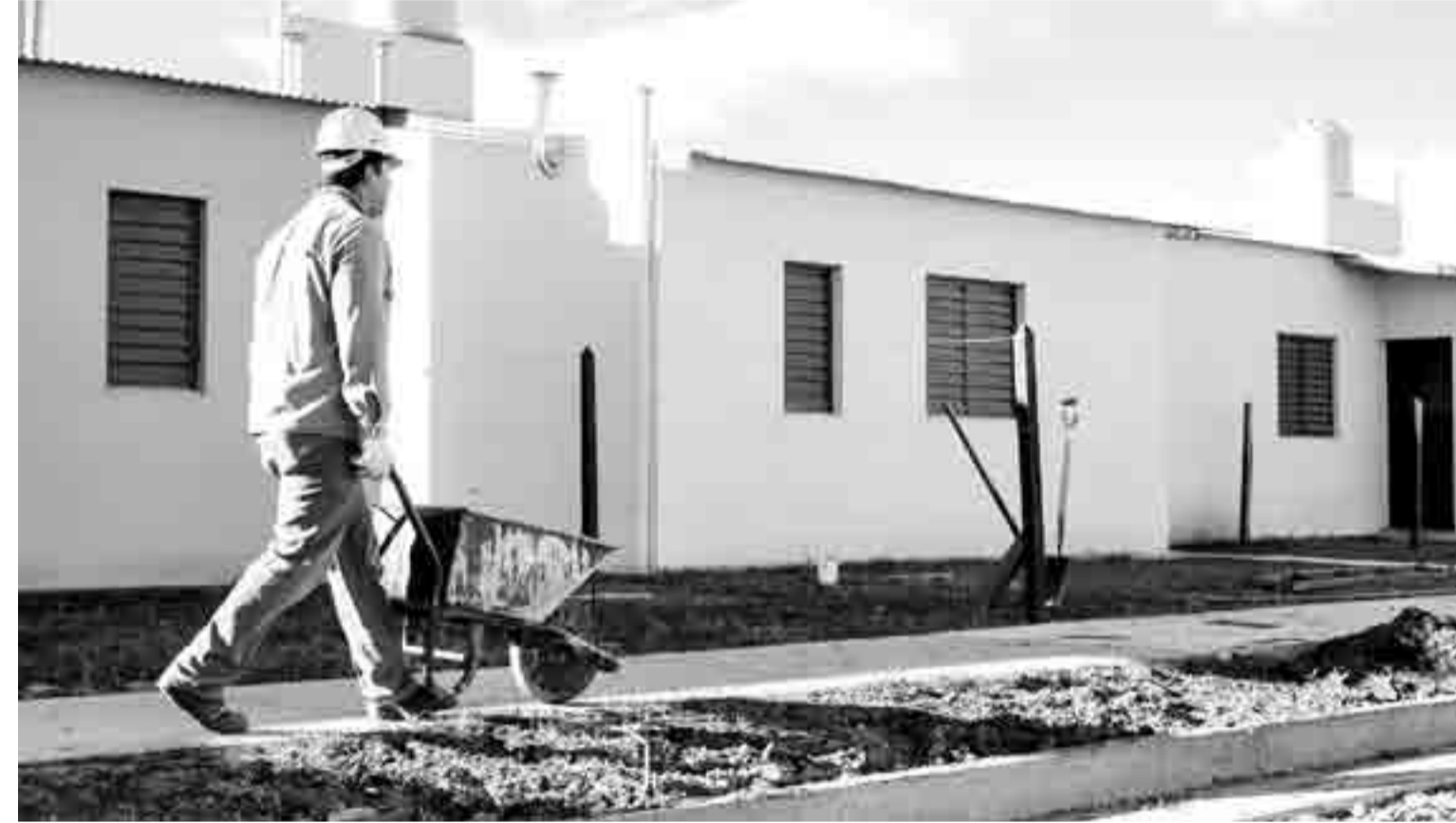
Frana recordó: "lo dijimos el primer día de gestión y lo ratificamos con el trabajo que hacemos semana a semana: hoy hay una firme decisión política del gobernador Omar Perotti de avanzar con obras que contribuyan a un hábitat digno y que faciliten el acceso a la vivienda".

"Por otra parte —continuó—, cogeconomamos con el Ministerio de Desarrollo Territorial y Hábitat de la Nación las diferentes líneas del programa Casa Propia, Construir Futuro, Casa Activa y Procrear".