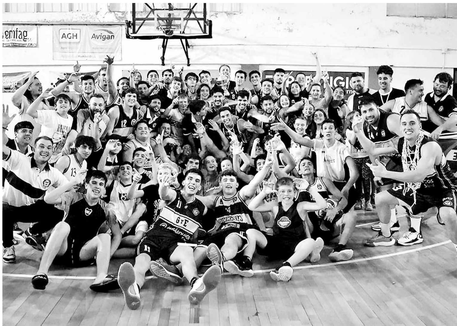
La alegría de todos los mensanas al finalizar la historia en Esperanza, con el título provincial para las gloriosas vitrinas del club.

En el segundo, ganando en lo defensivo, dominando su cristal y llegando con fluidez y paciencia, la visita metió un 9-0 en 5 minutos. Almagro no pudo cortar la racha, que consiguió quebrar Aisenstein con un libre sobre