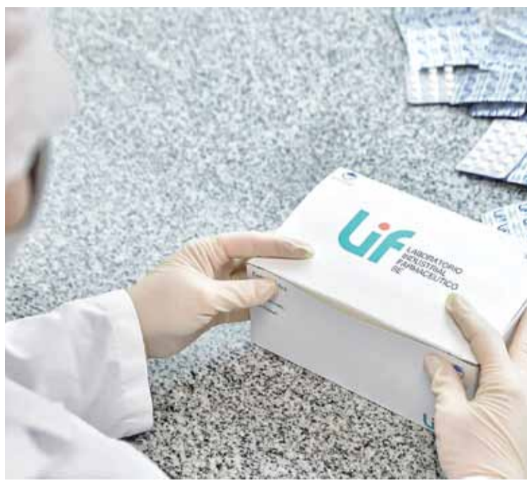
De las 45 especialidades medicinales que se producen actualmente en el LIF, 19 cuentan con certificación de la Anmat.