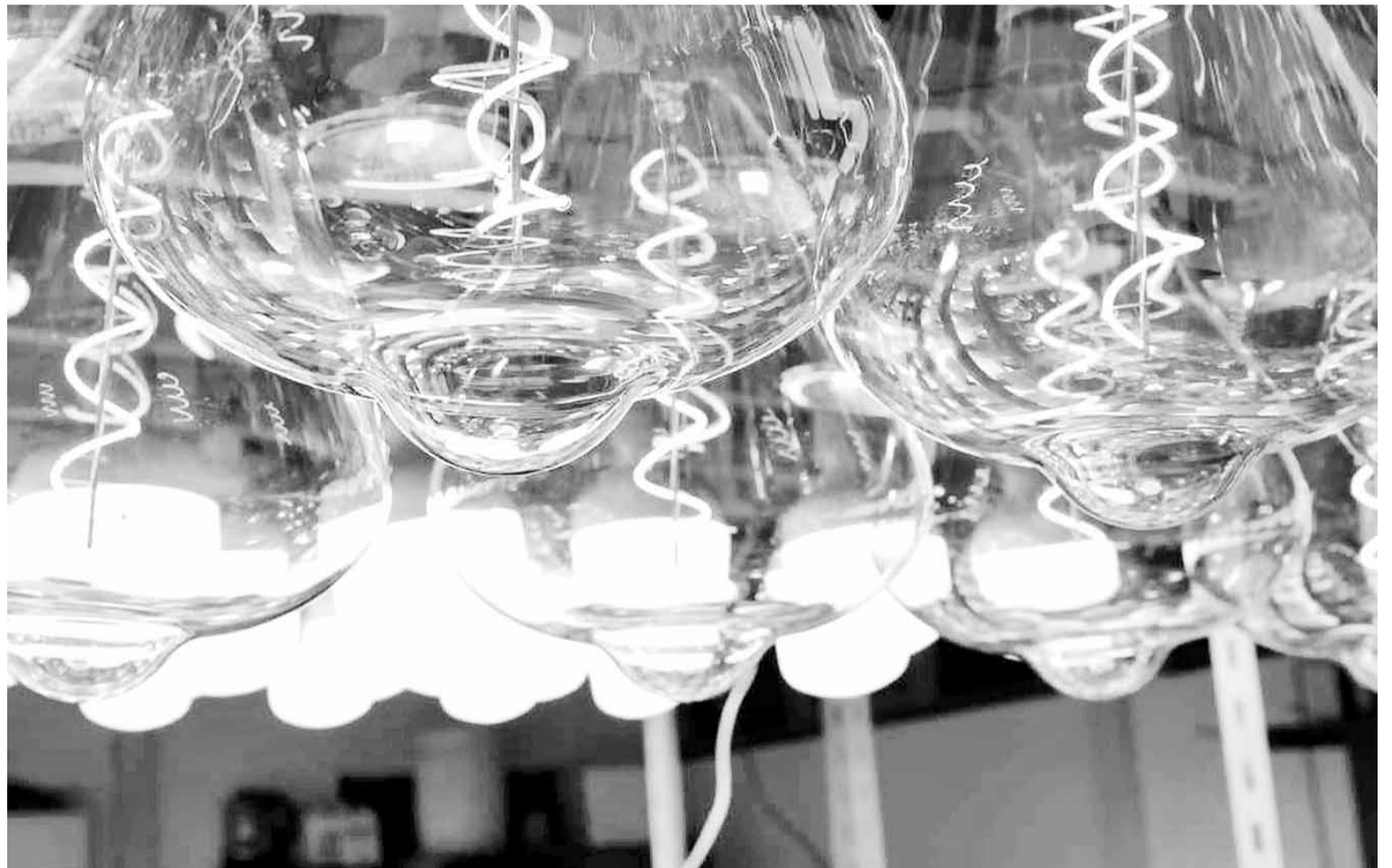
2.000 lámparas LED tienen encendidas en simultáneo en el laboratorio de la UTN.