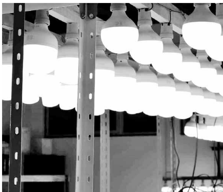
De los ensayos que se van realizando, el ingeniero sostuvo que “la mayoría de las lamparitas está en condiciones” y aseguró que “el porcentaje que no cumple, es bajo”.