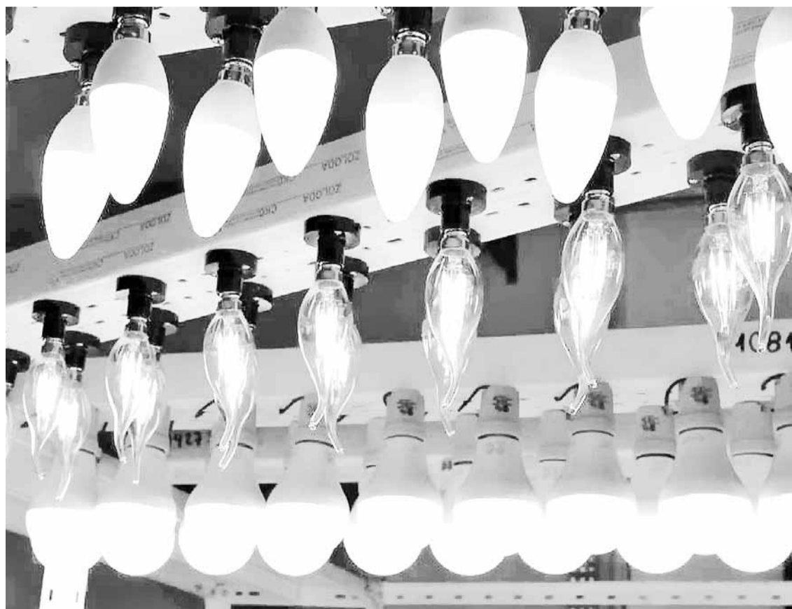
“Con estas pruebas, vamos a empezar a separar la paja del trigo, y con la certificación lo que debería quedar en el mercado son aquellas que cumplen con lo que dicen sus etiquetas”, sostuvo el director del laboratorio.

“Lo que sí encontramos en algunos casos es que en lugar de clase A+, es sólo clase A. Ahí el fabricante debe re-etiquetar para poder venderlas. De esos casos sí encontramos unos cuantos”, ejemplificó.