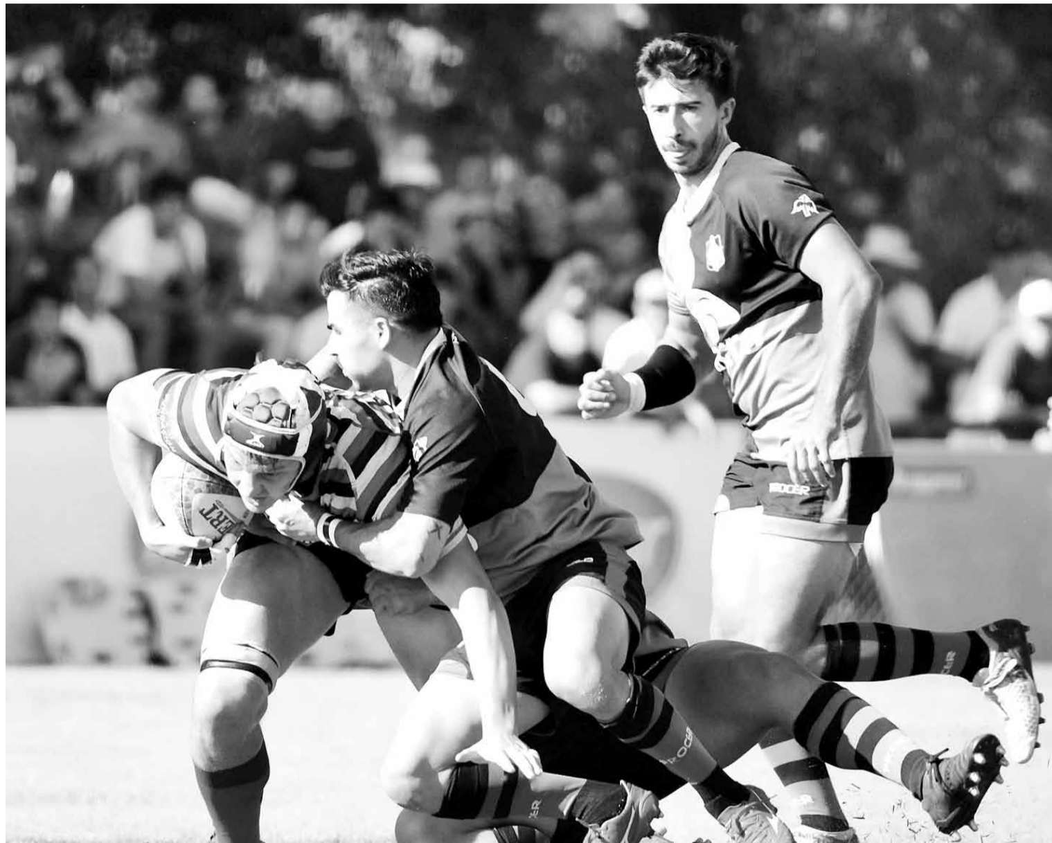
Se dieron con todo. Santa Fe Rugby venció 23-21 sobre el final a Duendes pero tuvo que batallar y mucho para lograrlo. Los fuertes y efectivos tackles en defensa fueron fundamentales.

Luego de varios minutos de posesión de Santa Fe rugby, otra vez Duendes, con más amor propio que buen juego, se posicionó en