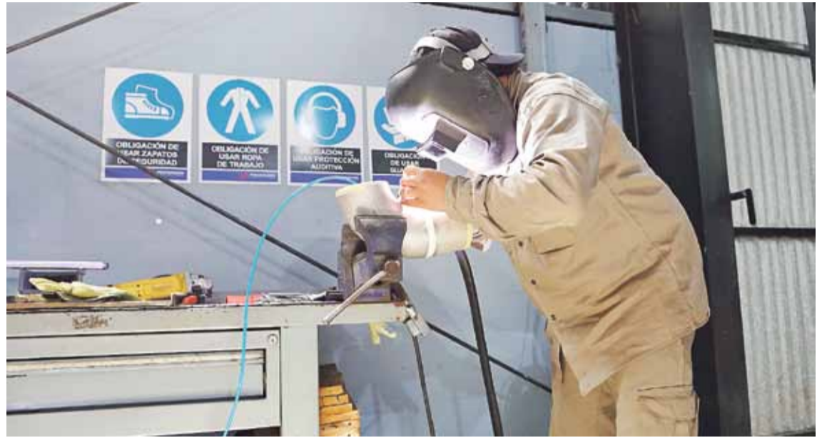
Las exportaciones fabriles en la provincia, en tanto, tuvieron un “dispar” resultado al comienzo de enero, según refleja el informe de Fisse. Mientras que las manufacturas de origen industrial alcanzaron “buenos resultados”, las de origen agropecuario se contrajeron tanto en valor como en volumen.

provincia, en tanto, tuvieron un “dispar” resultado al comienzo de enero, según refleja el informe de Fisse. Mientras que las manufacturas de