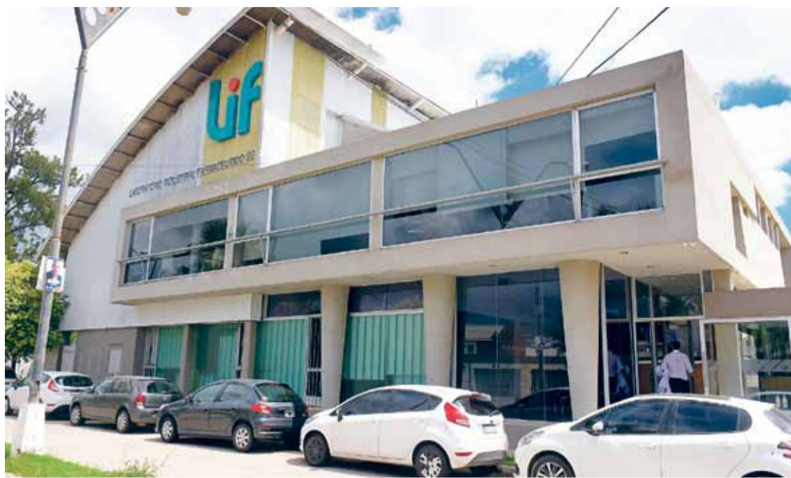
En 2021, el Laboratorio Industrial Farmacéutico aumentó en un 1.190% el presupuesto destinado a obras y un 268% el presupuesto destinado a la adquisición de maquinarias y equipamientos.