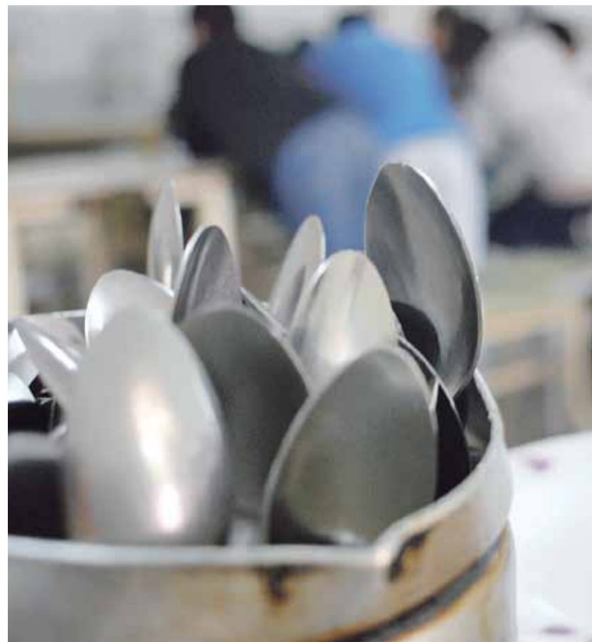
La generación de empleos formales es uno de los pedidos para salir de la situación de pobreza.

Para ejemplificar este aumento de personas con necesidad de un vaso de leche, jugo, unas masi-