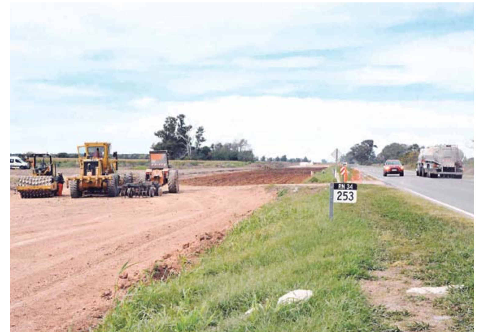
La obra tendrá una inversión estimada en $ 7.000 millones y a parte de la duplicación de la calzada se construirá un intercambiador en el acceso a Lehmann y otro en el cruce de Ruta 13.

Vialidad Nacional progresa con las obras de mejoramiento de la Ruta Nacional N° 7 en su paso Santa Fe, en el sur provincial. En base a un contrato recuperado y puesto en marcha a fin de 2021 por el Ministerio de Obras Públicas de la Nación, las obras abarcan desde la laguna La Picasa hasta el límite entre Santa Fe y Córdoba. Los arreglos comprenden el bacheo en los puntos más deteriorados de la calzada, más el fresado de deformaciones, para completar las mejoras con la repavimentación de los sectores intervenidos. De este modo, en poco tiempo y pese a las copiosas lluvias, se ha logrado repavimentar unos seis kilómetros en la zona de Aarón Castellanos, lo que mantiene la ejecución dentro de los plazos previstos.