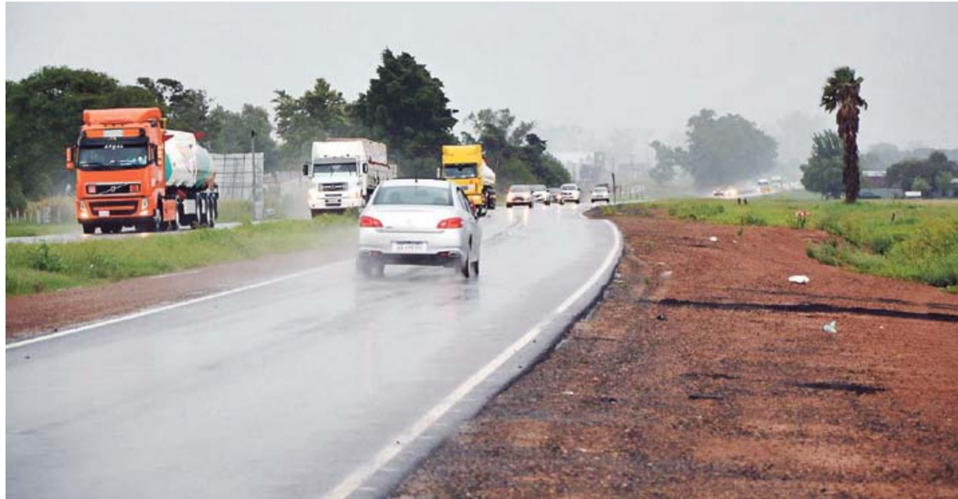
La vía que circunvala al casco urbano rafaelino está avanzada y se está trabajando en los puentes sobre las vías de ferrocarril, una que está muerta, al sur, y la otra, al norte, que está activa y es del Belgrano Cargas.

El impulso que cobraron los trabajos en los últimos dos años, luego de las marchas y contramarchas de la administración nacional anterior, que prácticamente los paralizó y solo ejecutó un puñado de kilómetros, hace suponer que en no mucho tiempo más una de las obras estratégicas y de mayor magnitud planteada, y largamente anhelada, en la región será una realidad.