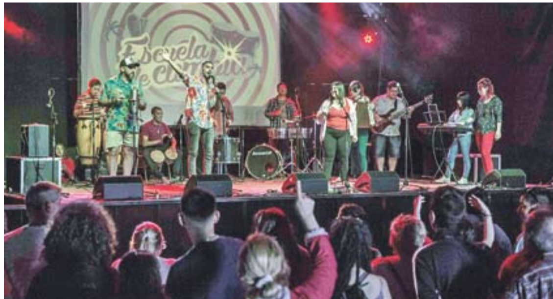
Las clases comenzarán el 19 de abril y el cursado será los martes y jueves de 14 a 17, con 2 niveles en función del tránsito por la escuela o los saberes previos.

La Escuela de Cumbia es un espacio que ofrece la Municipalidad de Rosario, a través de la Dirección de Juventudes, a jóvenes a partir de los 15 años con algún tipo de experiencia en creación musical