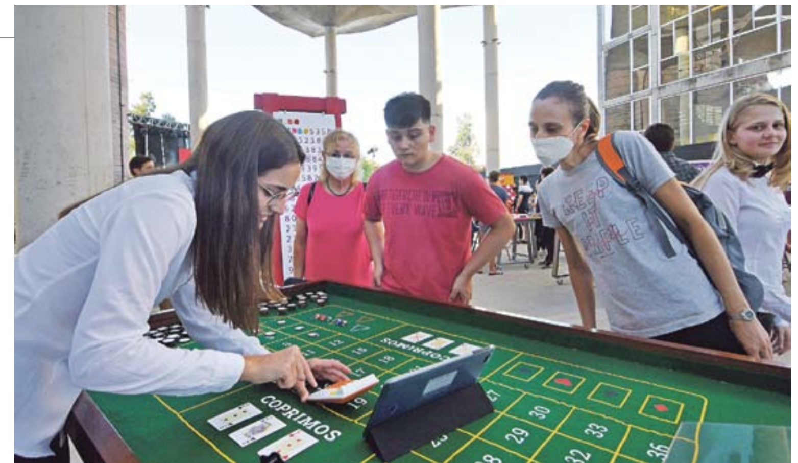
En el bar de juego cada participante elegía su menú, que era un ejercicio matemático.

Pero además, los Paytons hacían búsquedas de fechas de cumpleaños en Pi. “Alguien viene y nos da su fecha de nacimiento. Aún no está probado, pero se estima que al ser Pi un número tan grande en dígitos e infinito, se podría encontrar en todas las combinaciones de fechas de nacimientos. La cifra más larga hasta ahora fue de una chica: con su cumple llegó a los 2 millones