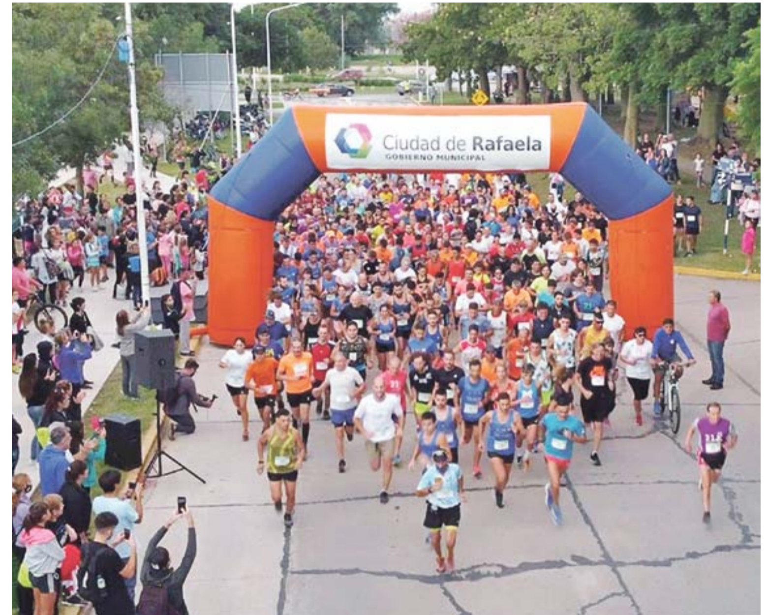
“Decidimos hacer esta maratón en este mes de marzo porque aprovechamos que comenzamos a volver a la normalidad y a poder tener actividades recreativas y deportivas que hasta el momento no podíamos tener”.

Villafañe sumó que “es importante poder empezar a disfrutar actividades que por un tiempo fueron postergadas. En este mes de marzo, estamos corriendo una carrera por la noche a la que no estamos acostumbrados normalmente. Estamos felices y agradecidos por esta propuesta del Estado