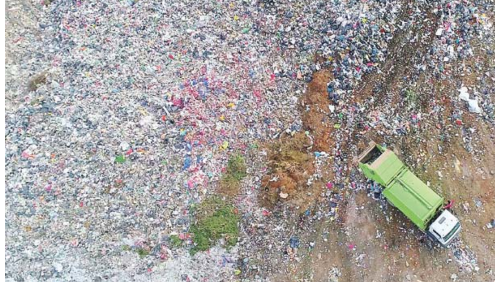
La basura no sólo es un problema social y ambiental, sino también es económico. Tanto su tratamiento como enterrarla en rellenos sanitarios en la localidad de Ricardone y Bella Vista tiene un costo millonario para la ciudad.

Entre puntos a destacar que los concejales deberán evaluar para