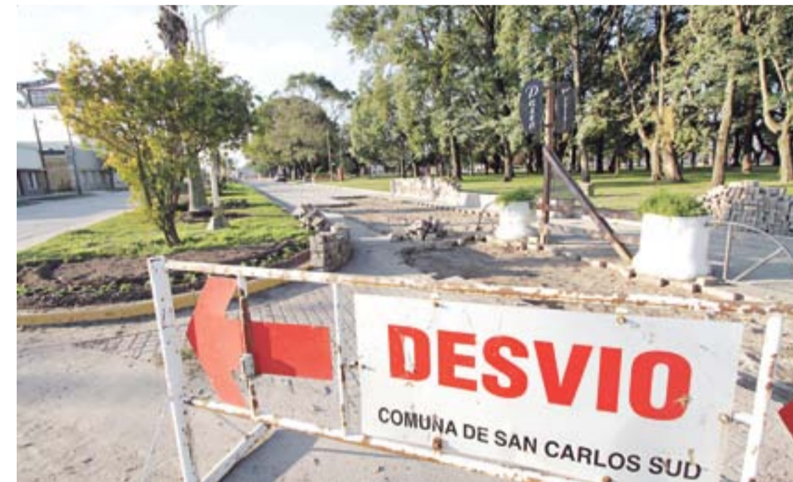
Primo agregó que se sancionó la ordenanza y se notificó a cada uno de los frentistas para que estén informados sobre los detalles de la obra y el plan de financiación.

Después de 25 años la Comuna de San Carlos Sud propone a los vecinos la pavimentación de calle Pje. América (entre Rivadavia y 9 de Julio) y calle Güemes entre (Carlos Beck Bernard y San Martín) mediante el sistema de Contribución por Mejoras.