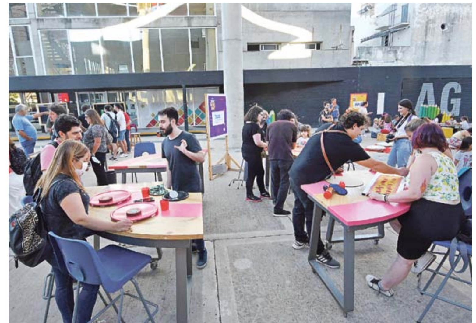
El péndulo y las bolas, “calibradas” con precisión en la longitud de cada una de ellas.