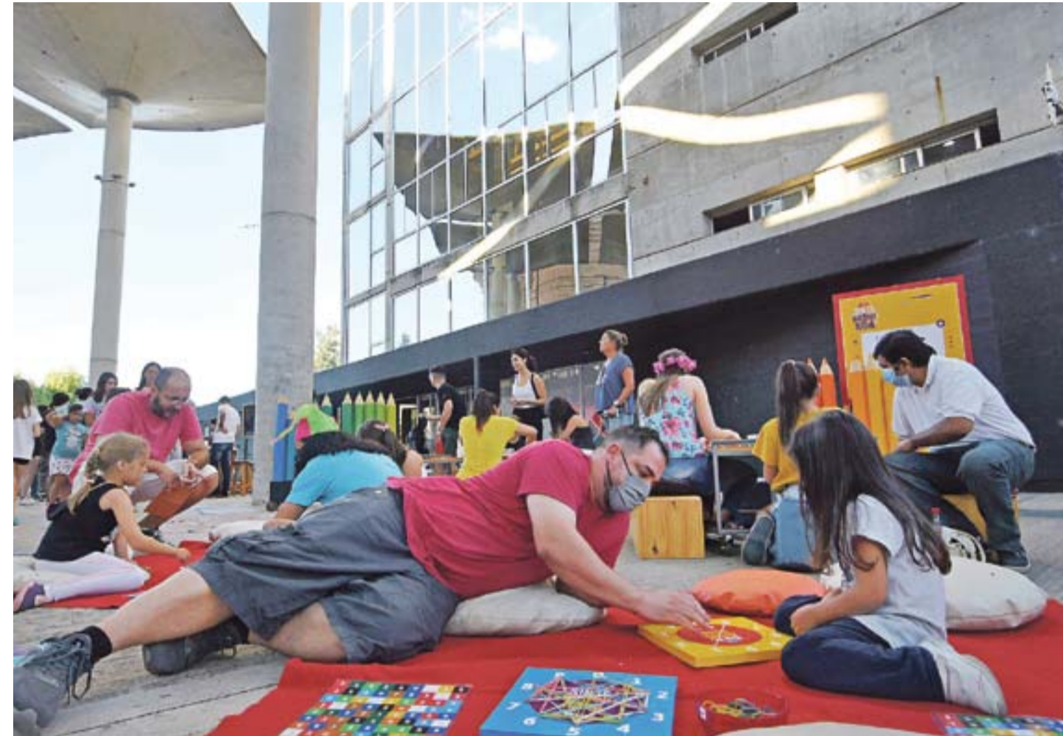
El sector infantil contó con una alta concurrencia de niños y sus papás.

“¿Cómo que un casino para aprender matemáticas?”, pregunta ingenuo un jovencito que recién entraba al evento. Sí, allí estaban dos estudiantes de matemática aplicada, que con una paciencia de monje budista explicaban en qué consistía la actividad: principios de aleatoriedad. Más allá un bar (de juego, claro), y los mozos eran estudiantes y divulgadores, y había mesas, y cada participante elegía la “comida” del menú, como las porciones de una pizza de cartón, y allí se iban a sentar con el desafío de un desciframiento matemático.