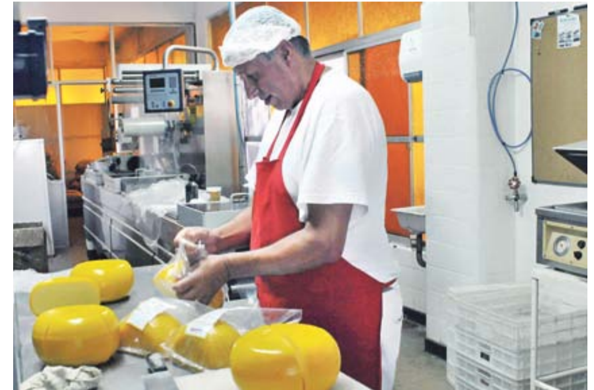
Los rubros cubiertos fueron lácteos, legumbres, maíz pisingallo, harinas, gluten, almidones nativos y modificados, dextrinas, proteínas y premezclas, yerba mate. También, servicios de consultoría procedentes de localidades como Esperanza, Hughes, Rosario, Uranga, Franck, Santa Isabel, Carcarañá y Frontera.

Gulfood es considerada la mejor plataforma de negocios para la industria de alimentos y bebidas de Medio Oriente y África. Está dirigida exclusivamente a un público profesional: agentes comerciales, importadores y distribuidores. La feria permite establecer contactos de muy variada procedencia geográfica. Los países del Golfo cuentan con una población de 57 millones de habitantes; un PBI de 1,3 billones de dólares y un PBI per cápita cercano a los 24.000 dólares anuales. La economía de Oriente Medio demanda anualmente alrededor de 430.000 millones de dólares en importaciones, de los cuales los alimentos constituyen cerca del 20% del total. Los Emiratos constituyen, además, una importante puerta de ingreso de productos que luego son derivados a los países de la región.